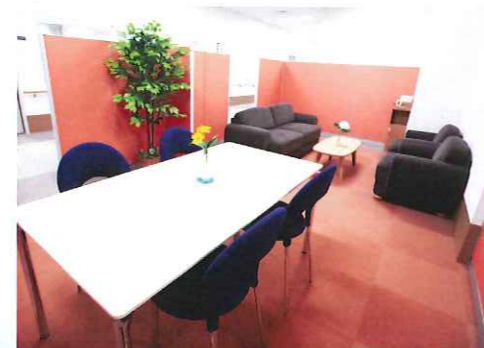
相談ボランティアコーナー