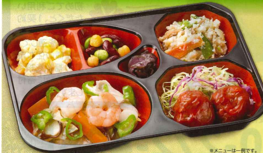
※メニューは一例です。

20品目以上 (食材数・毎日) 食塩相当量3.5g 以下(週平均) 400kcal基準 (週平均) ※お茶碗一杯分(約150g)のごはんと一緒に召し上がって頂くと合計約650kcal 5日間 1人前 3,080円 (税込) 1食当り 616円 (税込) 7日間 1人前 4,468円 (税込) 1食当り639円 (税込) 2人前 5,760円 (税込) / 1食当り576円 (税込) 2人前 8,166円 (税込) 1食当り584円 (税込)