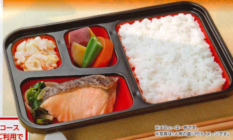
※メニューは一例です。 ※写真は1人用の盛り付けイメージです。

10品目以上 (食材数・毎日) 食塩相当量2.0g 以下(週平均) 400kcal基準 (週平均) ※ごはんは、毎日白飯です。 5日間 1人前 2,490円 (税込) 1食当り 498円 (税込) 7日間 1人前 3,654円 (税込) 1食当り522円 (税込) 2人前 4,580円 (税込) / 1食当り458円 (税込) 2人前 6,538円 (税込) 1食当り467円 (税込)