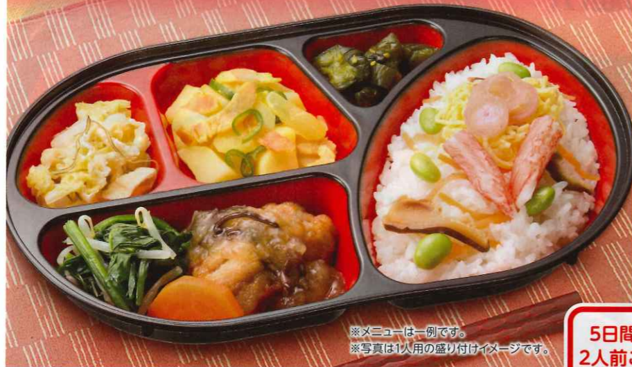
※メニューは一例です。 ※写真は1人用の盛り付けイメージです。

15品目以上 (食材数・毎日) 食塩相当量2.5g 以下(週平均) 500kcal基準 (週平均) ※ごはんは、原則 火曜・金曜は変わりごはんです。 5日間 1人前 2,900円 (税込) 1食当り 580円 (税込) 7日間 1人前 4,228円 (税込) 1食当り604円 (税込) 2人前 5,400円 (税込) / 1食当り540円 (税込) 2人前 7,686円 (税込) 1食当り549円 (税込)