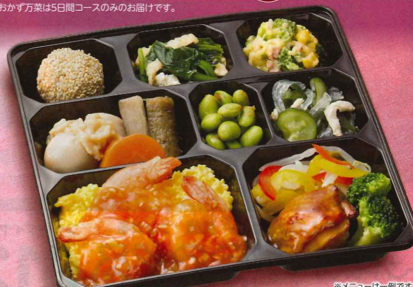
※メニューは一例です。