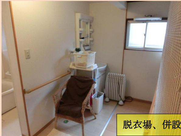
脱衣場、併設トイレ②