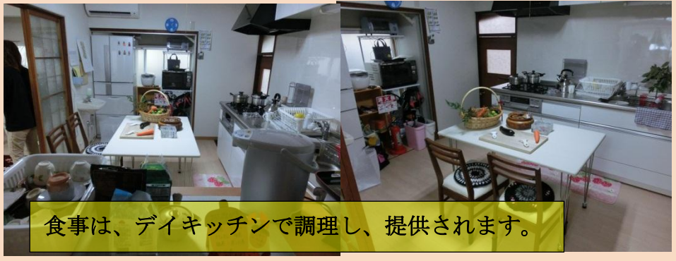
食事は、デイキッチンで調理し、提供されます。