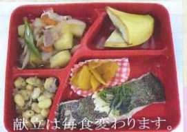
献立は毎食変わります。