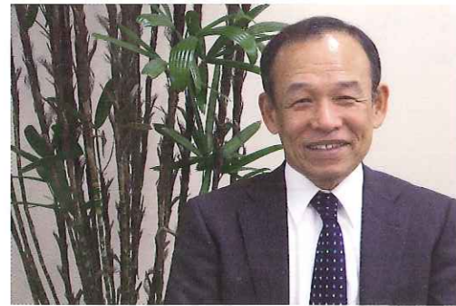
JA協同サポート山口株式会社 代表取締役社長

シンボルマークは明るく輝く太陽がモチーフになっています。太陽を囲むコロナの部分は、Jサポを利用される人と施設スタッフをモチーフにし、明るくカラフルな色構成は施設内の良好なコミュニケーションを表現しています。サポートの文字は「人」がモチーフとなっており、柔らかな印象を与えます。