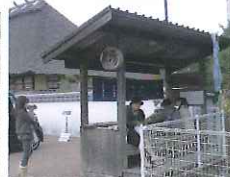
山田家隣、足湯 入浴無料

湯野は多くの宿泊施設・温泉。坊ちゃん像を始め見て歩きにとっても楽しいところです。きらきら星の近くにも懐かしさをおぼえる町並みが、続いています。