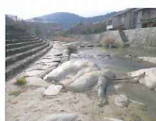
温泉の傍を流れる夜市川 散歩コース