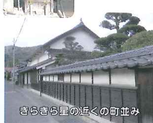
きらきら星の近くの町並み