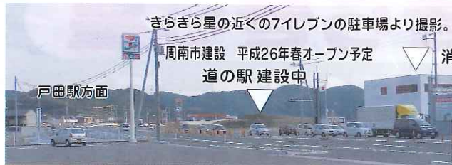
きらきら星の近くの7イレブンの駐車場より撮影。