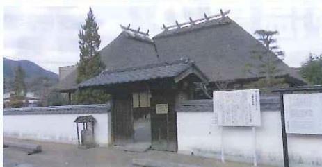
湯野 山田家本屋 入場無料