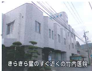
きらきら星のすぐ近くの竹内医院