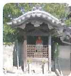
きらきら星の隣のお地蔵様