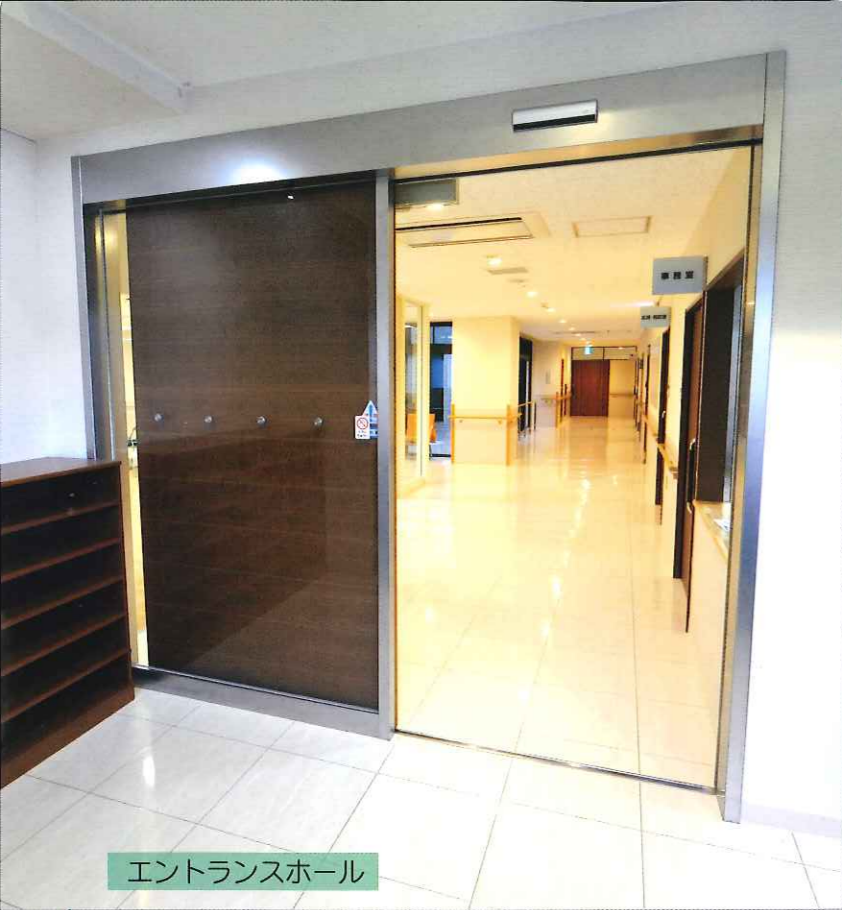
エントランスホール