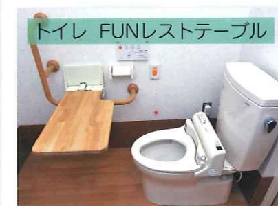
トイレ FUNレストテーブル