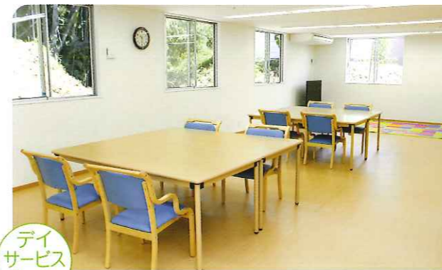
デイ サービス ルーム