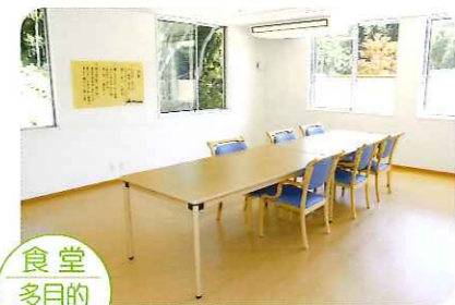
食堂 多目的 ホール