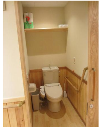
・共用トイレ（各階）