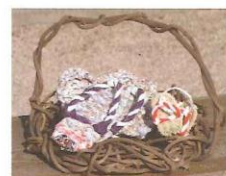
わらじ 800円～ シート1枚分の綿素材を使って 1足が出来ています。(大人用) 適度なかささと肌触りがとても 気持ちよいと評判です。