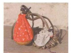
手芸品 300円～ お弁当袋、鍋つかみ、ランチョン マットなど。和柄布地は、意外と 和洋どちらの生活シーンにも マッチして重宝です。

NPO 法人聴覚障害者生活支援センター 「こすもすの家」 周南市速玉町7番26号