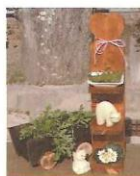
木製プランター他 450円～ 植木鉢を並べて飾ると素敵。 スリッパラックや小物入れ としても。