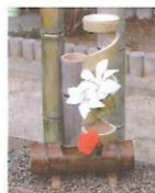
竹製花瓶 1000円～ 縦型、横型、手持ちつき、 サイズも色々あります。 他の竹製品も多数取り 揃えています。