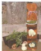
木製プランター他 450円～ 植木鉢を並べて飾ると素敵。 スリッパラックや小物入れ としても。