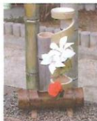
竹製花瓶 1000円～ 縦型、横型、手持ちつき、 サイズも色々あります。 他の竹製品も多数取り 揃えています。