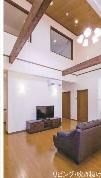
リビング・吹き抜け