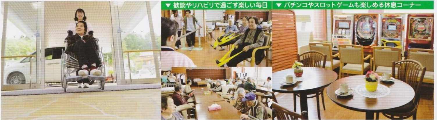
▼ 歓談やリハビリで過ごす楽しい毎日 ▼ パチンコやスロットゲームも楽しめる休憩コーナー

1F 周南高原デイサービスセンター 通いによる送迎をはじめ、リハビリや入浴、食事など、毎日のサービスと環境の充実をはかって地域の皆様に愛される施設を目指しています。