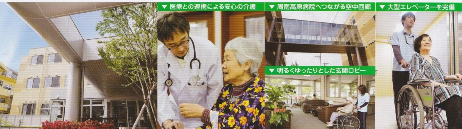
▼ 医療との連携による安心の介護