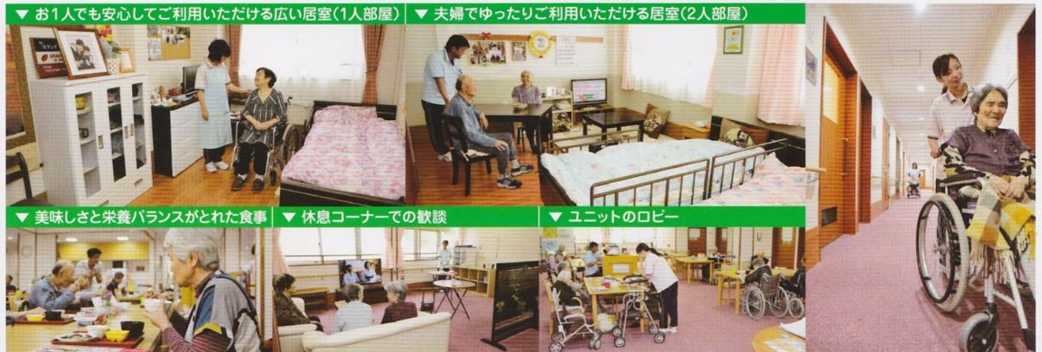
▼ お1人でも安心してご利用いただける広い居室(1人部屋) ▼ 夫婦でゆったりご利用いただける居室(2人部屋)

高齢者のための新しい住居として安心して暮らせる環境を整えています。毎日のリハビリから健康管理まで、介護と医療の連携でサポートします。