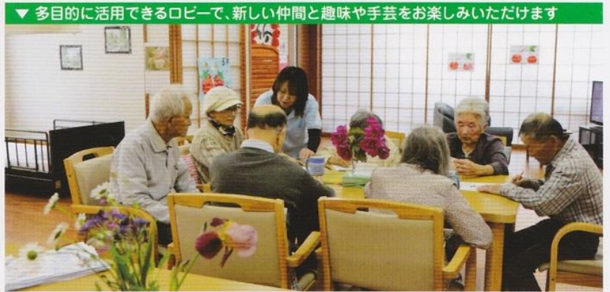
▼ 多目的に活用できるロビーで、新しい仲間と趣味や手芸をお楽しみいただけます