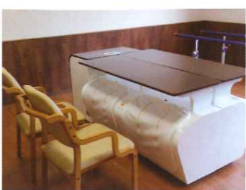
ナノミストバス/フットスバ