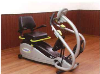
有酸素運動マシン