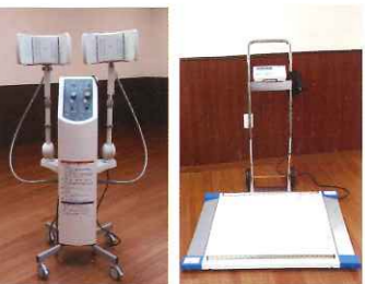
温熱機器 体重計(車椅子可)