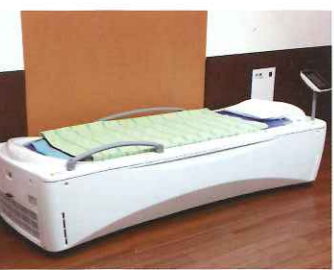
ウォーターベッド