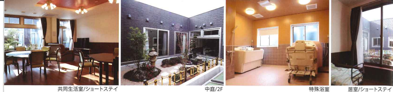
共同生活室/ショートステイ