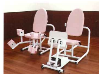
下肢・体幹機能向上マシン